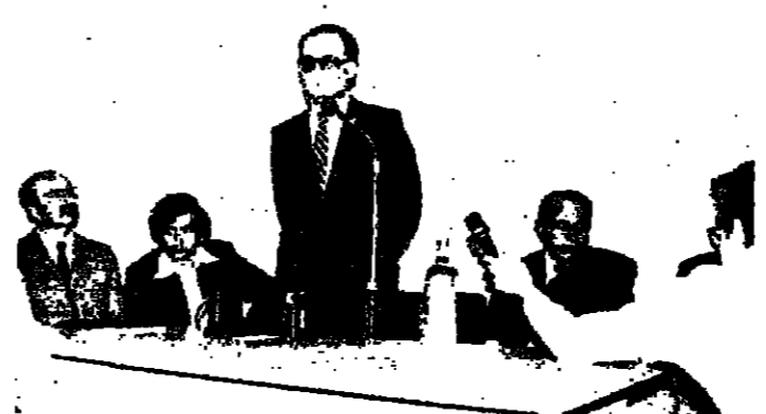
رئيس الحكومة محاضرا في كلية الحقوق